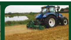
Trident HD i halm