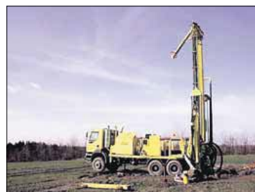
Vandboringer og undersøgelsesboringer af undergrunden kan give pesticidforurening af grundvandet efterfølgende viser ny rapport. (Arkivfoto)