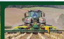
Trident 7600HD i majs